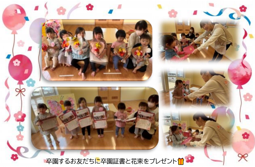
卒園するお友だちに卒園証書と花束をプレゼント🎁🌸